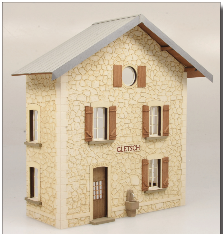
Foto zeigt ein Vorserien-Modell in Halbreief, das Modell wird als Vollgebäude erscheinen.